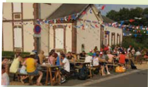
14 juillet - Comité des Fêtes - Repas Républicain