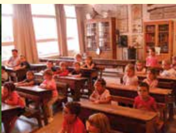
Séjour CRJS des MS et GS