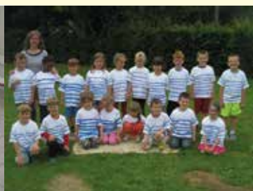
GS et CP pour les correspondants écossais