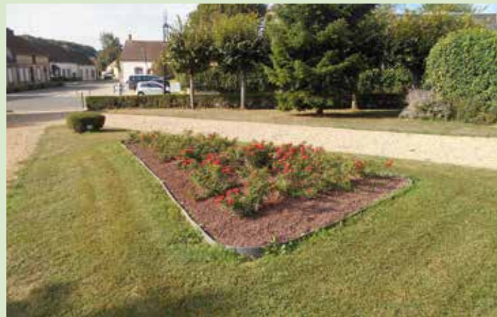
Aménagement massif devant église

coût à la charge de la Commune _____ 579 €