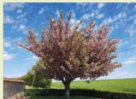
27 avril - Printemps sur Néron