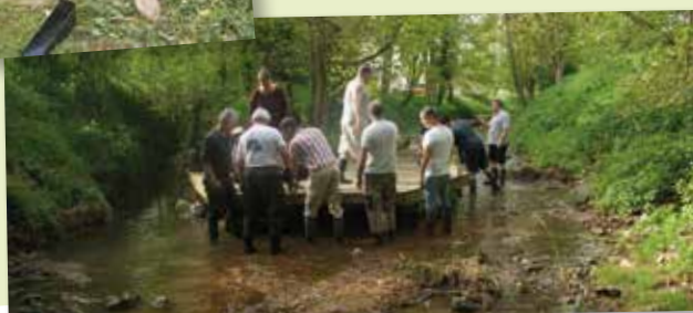
22 avril et 13 mai - Bénévoles - Démontage de la Ganivelle et réparation de ses pontons