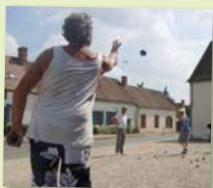
14 juillet - Comité des Fêtes - Concours de Pétanque