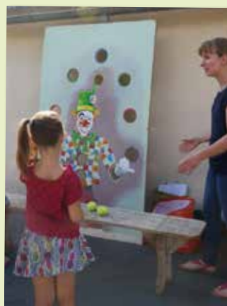
6 juillet - APE - Kermesse de l'école