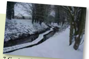
7 février - Néron sous la neige