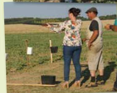
8 et 9 septembre - Société de Chasse - Ball Trap