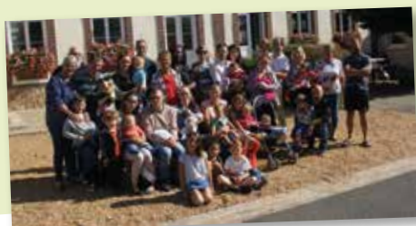
15 septembre - accueil des nouveaux arrivants et des bébés