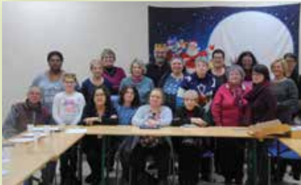
6 janvier - NDL - Assemblée Générale et galette des rois