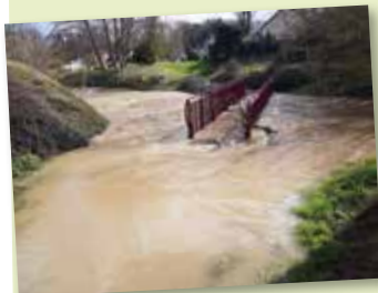
11 mars - Néron après l'orage (épisode 1)