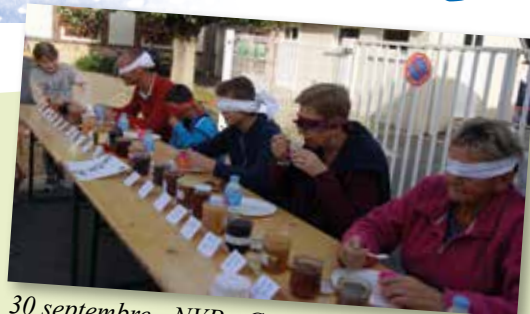
30 septembre - NVP - Concours de Confitures