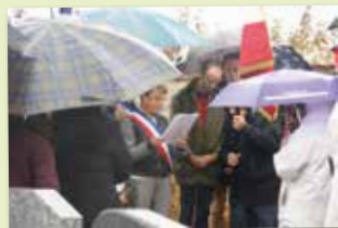
11 novembre - Commémoration de l'Armistice de 1918 au cimetière de Néron