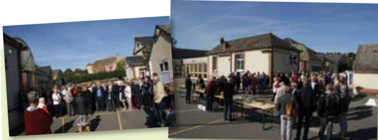
29 septembre - Rencontre des anciens élèves de l'École de Néron