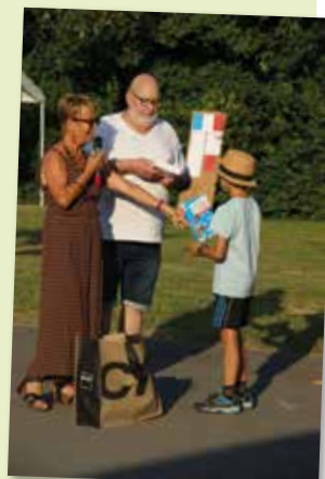
6 juillet - Remise des Livres pour les CM2