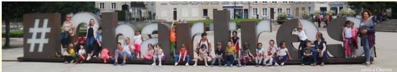
sortie à Chartres

L'école des Sources poursuit ses objectifs d'ouverture au travers de diverses activités parfaitement intégrées au programme scolaire.