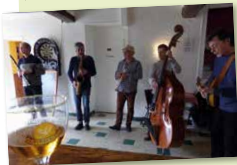
25 mars - Apéro «Jazz sous la Criée» au restaurant chez Maria