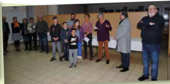
26 janvier - Vœux du Conseil Municipal