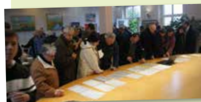
11 novembre - Commémoration de l'Armistice de 1918 - Exposition sur les Poilus Néronnais