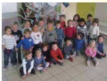
Arbre de Noël avec les PS et MS

Un grand merci à la Municipalité et à l'APE pour leurs subventions.