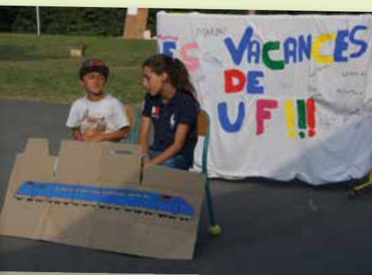
6 juillet - APE - Spectacle de l'école