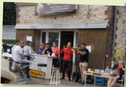
30 septembre - NDL - Vide-Grenier