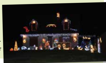
25 décembre - illuminations néronnaises