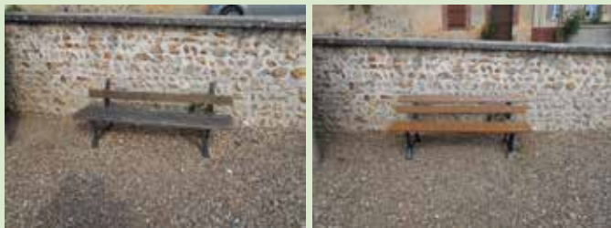
rénovation des bancs - AVANT/APRES