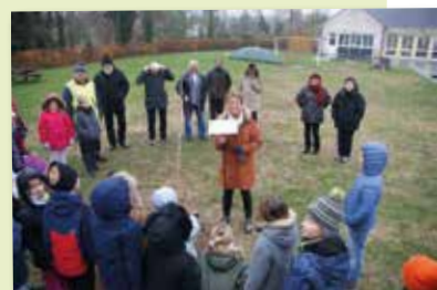
20 novembre - Plantation d'un Érable pour la semaine de l'arbre