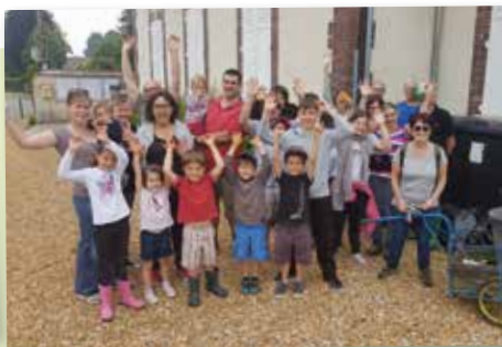
10 juin - CMJ - Nettoyage de Printemps