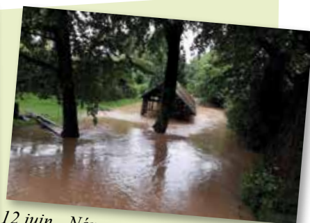
12 juin - Néron après l'orage (épisode 2)