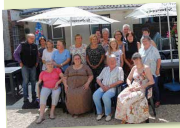
23 juin - NDL - Repas annuel