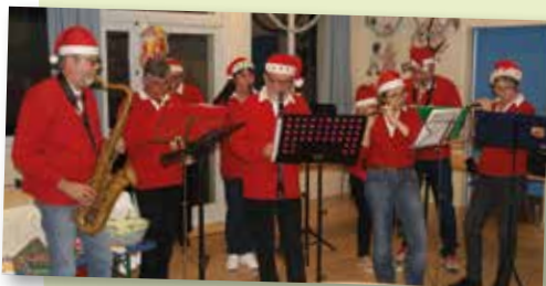
25 novembre - NDL - la BAND LA DO RÉ au Marché de Noël