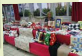
25 novembre - NDL - Marché de Noël