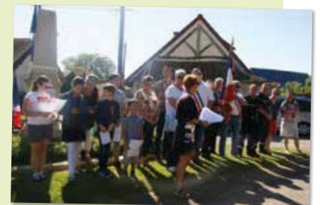
8 mai - Commémoration de la Victoire à Feucherolles