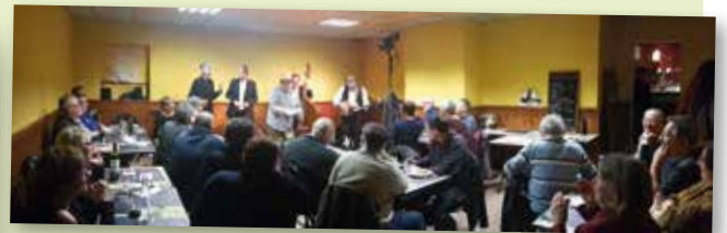
24 mars - Soirée «Jazz sous la Criée» au restaurant chez Maria