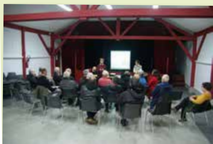
11 décembre - Réunion Publique PLUi avec le Cabinet CITTANOVA