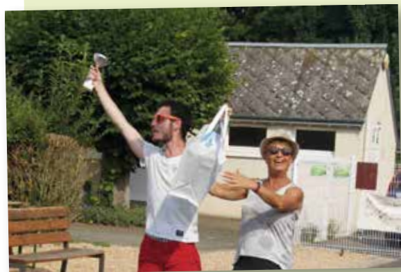
14 juillet - Comité des Fêtes - Remise des médailles