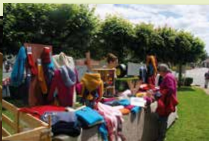
17 juin - NVP - Journée du Patrimoine de pays - L'homme et l'animal