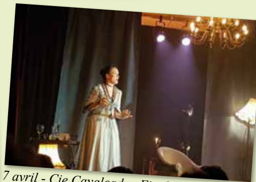
7 avril - Cie Cavalcade «Fin de Service»