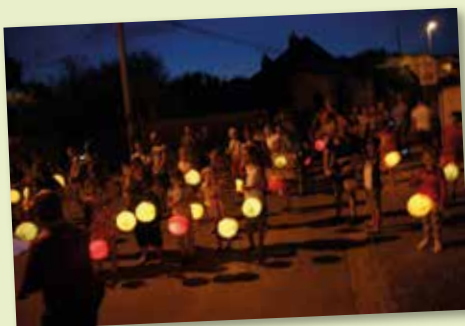
14 juillet - Comité des Fêtes - Retraite aux Flambeaux