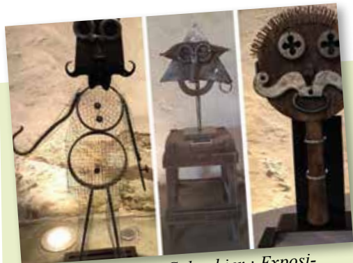
26 mai - Ferme au Colombier : Exposition de sculptures «Art Brut»