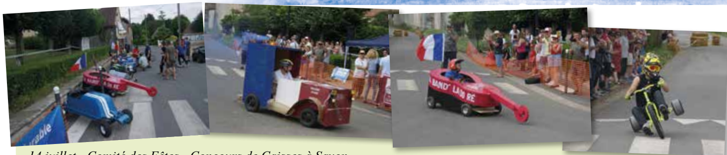
14 juillet - Comité des Fêtes - Concours de Caisses à Savon