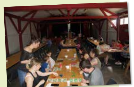
22 avril - APE - Loto