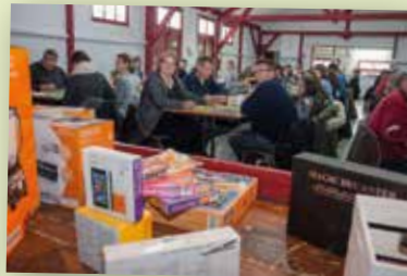
18 mars - NDL - Loto