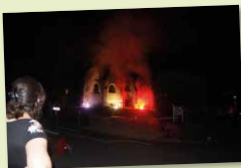
14 juillet - Comité des Fêtes - Illuminations de l'église